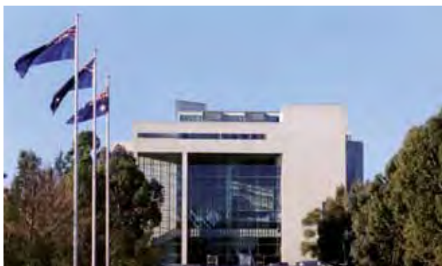
Mahakama Kuu ya Australia

Waziri mkuu huchagua Wabunge au Seneta kuwa mawaziri. Mawaziri huwajibika kwa maeneo muhimu ya serikali (inajulikana kama orodha ya kazi) kama ajira, maswala ya Watu wa asili, au Hazina. Mawaziri walio na Uwaziri mkubwa zaidi huunda Baraza la mawaziri, ambalo ndio funguo la halmashauri ya uamuzi wa Serikali ya Australia.