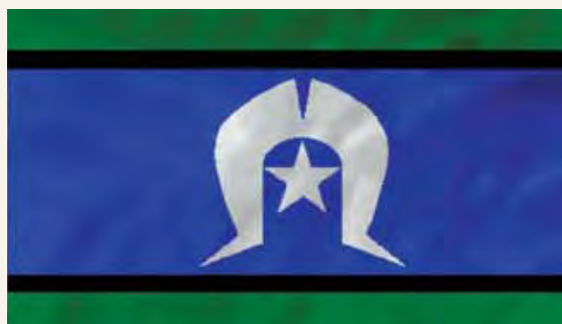
Bendera ya Watu wa visiwa wa Torres Strait ni kijani kibichi, bluu, nyeusi na nyeupe