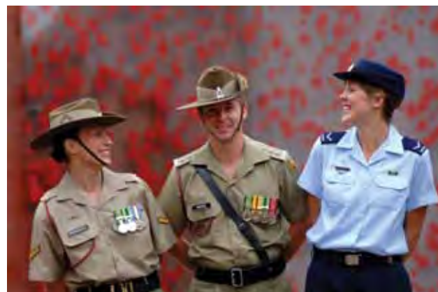
Wanaume na wanawake wanaweza kuungana na Jeshi, Jeshi la Wanamaji na la Wanahewa