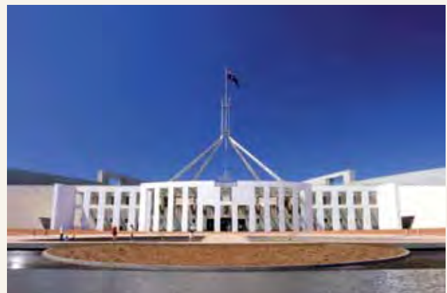
Nyumba mpya ya Bunge huko Canberra ilifunguliwa mnamo 1988

Wanachama wa nyumba zote mbili huteuliwa moja kwa moja na watu wa Australia katika uchaguzi wa shirikisho. Wakati unapiga kura katika uchaguzi wa shirikisho, kawaida wewe huteua wawakilishi wa kila Jumba.