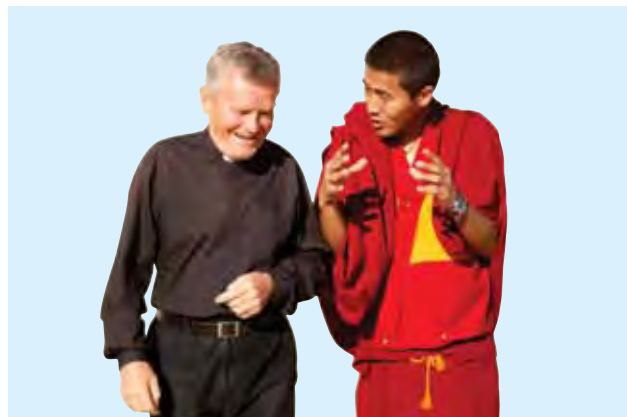
Watu huko Australia wako huru kufuata dini yoyote

Australia ina hadithi nyingi za wahamiaji wapya ambao wamekuwa viongozi katika biashara, wataalamu, sanaa, huduma ya umma na michezo kupitia bidii yao na vipawa vyao.