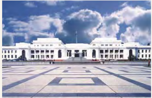
Nyumba mzee ya Bunge huko Canberra ilifunguliwa mnamo 1927

Mwanachama aliyeteuliwa na baraza la mtaani