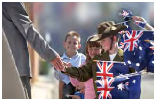
Siku ya Gwaride la Anzac