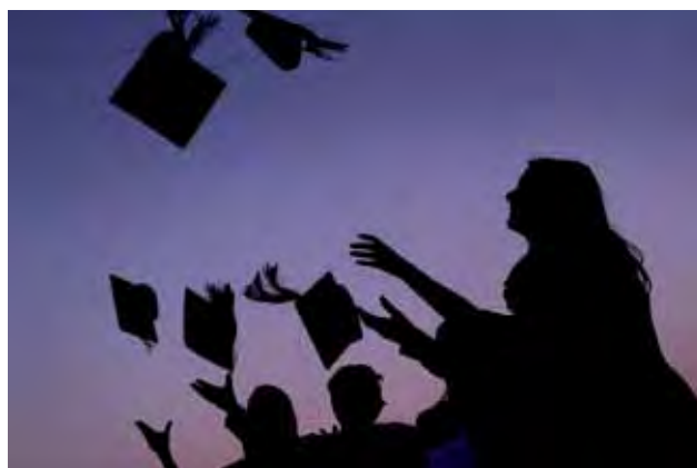
Waaustralia wote wana fursa ya kwenda kwa chuo kikuu