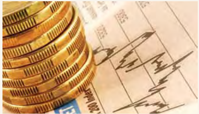
Serikali ya Australia inawajibika kwa usimamizi wa uchumi wa kitaifa

Majukumu mengine hushirikishwa kati ya viwango anuwai za serikali. Council of Australian Government (COAG) imewekwa kuhimiza ushirikiano kati ya viwango vya serikali.