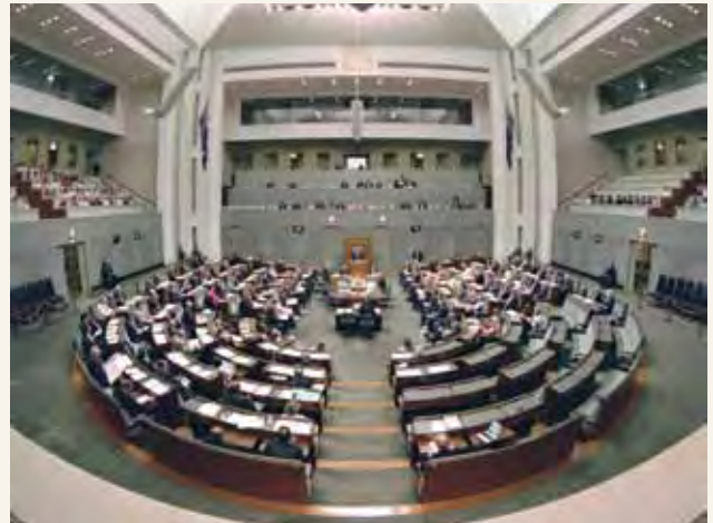
Wawakilishi wa Jumba

Kazi muhimu ya Jumba la Wawakilishi ni kuzingatia, kujadili na kupiga kura mapendekezo ya sheria mpya au mabadiliko ya sheria. Wanachama wa Jumba wa Wakilishi pia hujadili maswala ya umuhimu wa taifa.