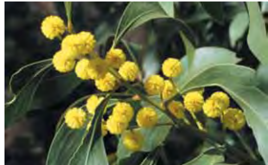
Ufito wa dhahabu

Maua ya kitaifa ya Australia ni ufito wa dhahabu. Mti huu mdogo hukua haswa katika kusini-mashariki Australia. Ina majani ya kijani kibichi na maua mengi ya manjano dhahabu wakati wa majira ya kuchipua. Kila jimbo na wilaya za Australia pia zina nembo yake ya maua.