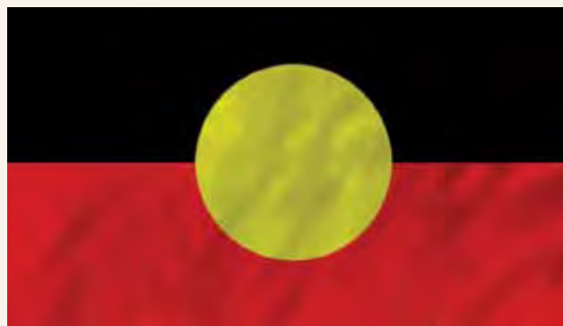
Bendera ya Watu wa asili ya Australia ni nyeusi, nyekundu na manjano