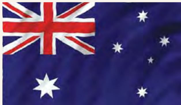
Bendera ya Kitaifa ya Australia ni bluu, nyeupe na nyekundu