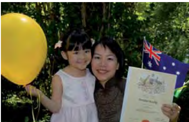
Hafla nyingi za uraia hufanywa Siku ya Australia kila mwaka

Usiku wa kuamkia Siku ya Australia, Waziri Mkuu hutangaza Tuzo ya Mwaustralia wa Mwaka huo huko Canberra.