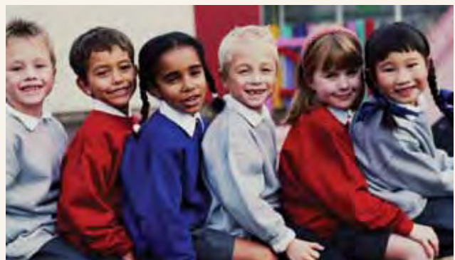
Serikali za mitaa zinawajibika kwa viwanja vya michezo