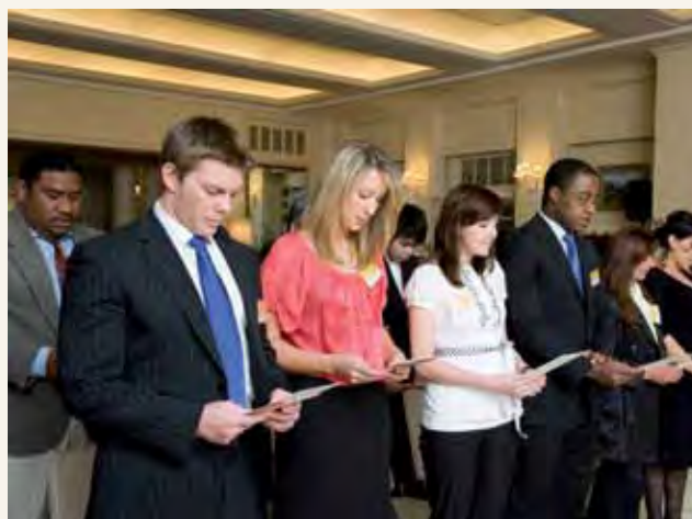
Raia wapya wa Australia katika hafla yao ya uraia

Tunakutakia kila la heri katika kuwa raia wa Australia na katika kutafuta maisha yenye amani na yenye mazao hapa Australia.