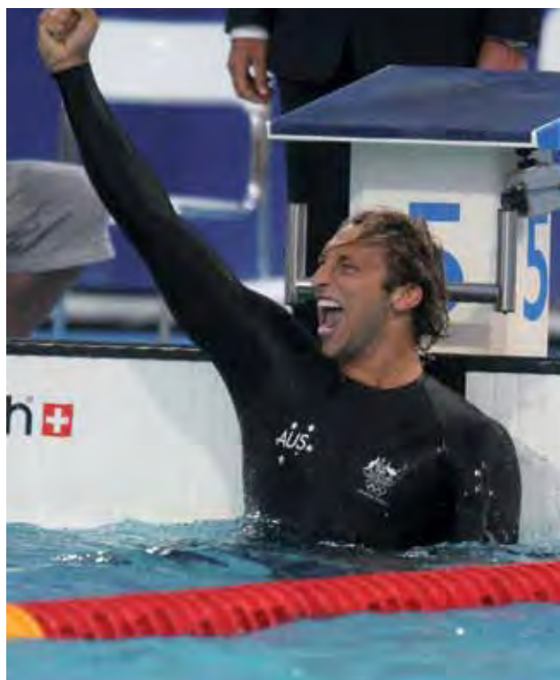
Mshindi wa dhahabu mara tano kwa Olimpiki, Ian Thorpe

Kombe la Melbourne, 'mbio ambayo hukomesha taifa', ni mojawapo ya mbio za farasi tajiri sana na zenye changamoto zaidi ulimwenguni. Kombe la kwanza la Melbourne lilifanyika mnamo mwaka wa 1861. Jumanne ya kwanza ya Novemba, Siku ya Kombe la Melbourne, imekuwa sikukuu ya umma katika Victoria tangu 1877.