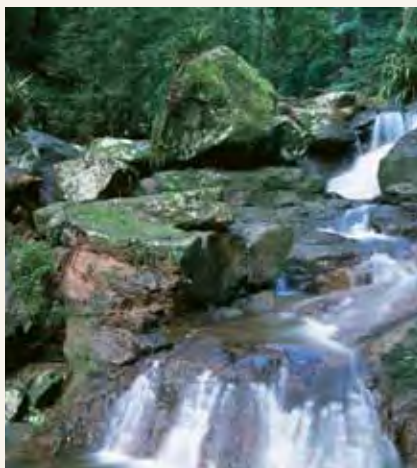
Misitu ya mvua ya Gondwana ya New South Wales na Queensland