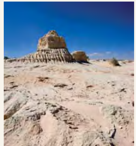
Willandra Lakes huko New South Wales