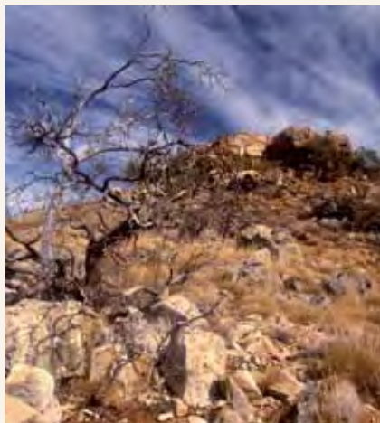
Maeneo ya Visukuku vya Wanyama huko Australia Kusini na Queensland

Zaidi ya asilimia 11 ya nchi yetu imelindwa na nchi ya asili, hifadhi au mbuga la kitaifa ambalo huendeshwa kwa utunzaji kwa viwango vya kimataifa. Maeneo kumi na saba ya Australia yameorodheshwa kwenye orodha ya Urithi wa Ulimwengu wa Shirika la Kielimu, Kisayansi na Kitamaduni la Umoja wa Mataifa (UNESCO) United Nations Educational, Scientific and Cultural Organization.