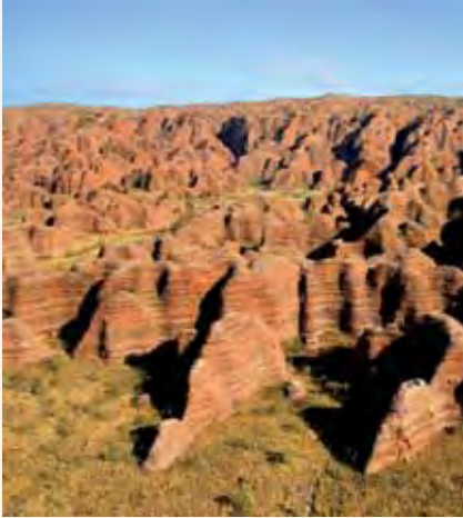
Mbuga la Kitaifa la Purnululu Magharibi mwa Australia