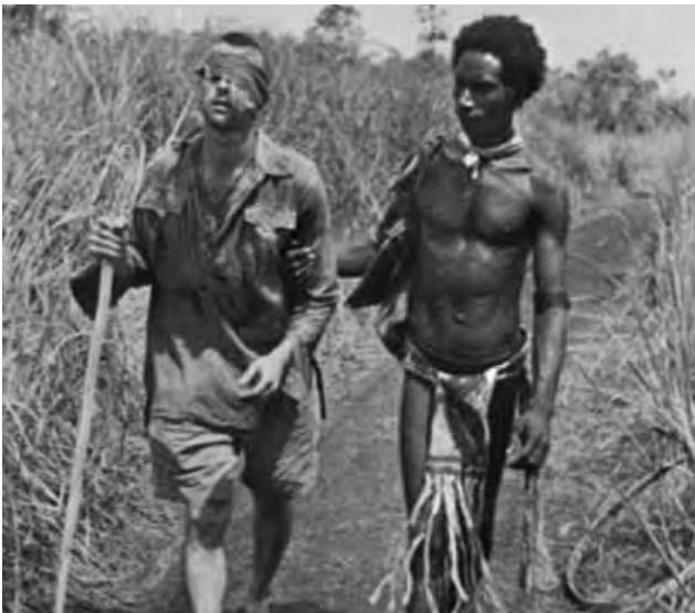
Askari aliyeumia kwenye Kokoda Track walisaidia na mbeba Papua

Baada ya Japan kuvumbua vita katika Pasifiki, wanajeshi wa Australia walikuja nyumbani. Kabla yao kurudi, Papua na New Guinea walihitaji kulindwa. Kazi hii ngumu ilipeanwa kwa wanajeshi wa kawaida na wanajeshi vijana mujibu wa sheria ambao hawakuwa wamefunzwa vyema. Walipigana na adui katika msitu, kwa njia ya wima ya matope inaojulikana kama Kokoda Track. Wanajeshi wa Australia walikomesha uvamizi wa Wajapani na Kokoda Track waliunga Anzac Cove huko Gallipoli kama sehemu ya safari yake kwa Waustralia wengi.