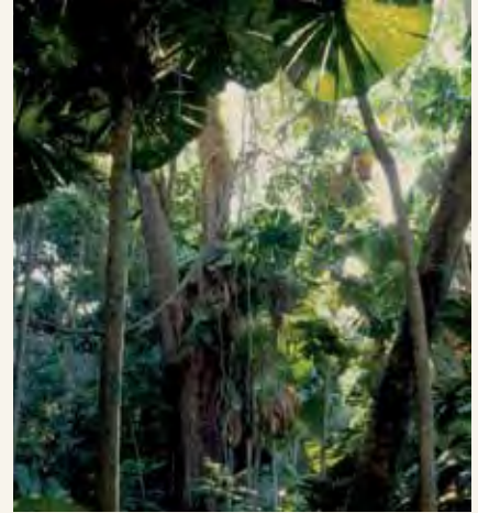
Maeneo yenye Umaji ya Queensland