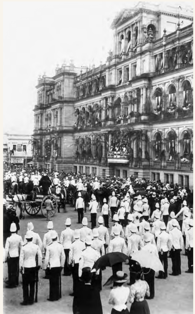
Siku ya Shirikisho huko Brisbane, 1901

Baada ya kuchelewa, hatua ya shirikisho ilipata kasi mnamo 1893. Wapiga kura walichagua wanachama wa kongamano lililofuata la katiba. Wapiga kura walipiga kura kwa awamu mbili za kura ya maoni na walikubali katiba. Ukweli kwamba mchakato wa shirikisho ulikuwa kwa msingi wa matamano ya watu ulionyesha jinsi Australia inayoendelea ilikuwa.