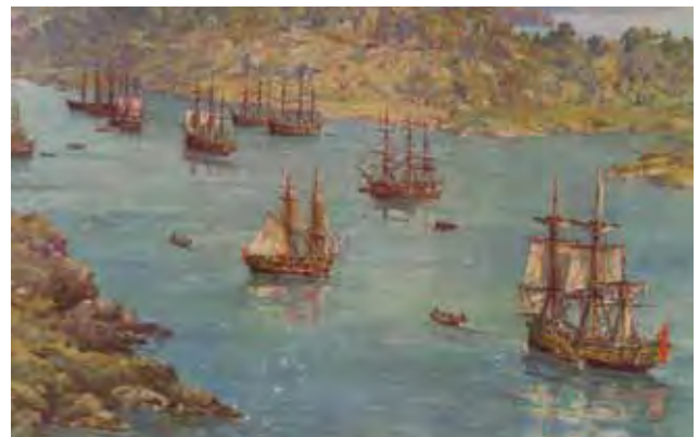
Kundi la Kwanza la Meli (First Fleet) kutoka Briteni, ikiwasili kutoka Sydney Cove mnamo 1788

Kapteni Philip aliongoza Kundi la kwanza la Meli (First Fleet) kwenda Sydney Cove mnamo 26 Januari 1788. Ni wakati wa ukumbusho wa siku hii ambayo tunasherehekea Siku ya Australia kila mwaka.