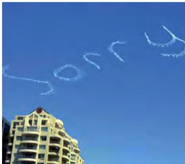
Mwandikishi wa angani anaandika 'Samahani' kule Sydney

Leo, mchango wa thamani wa watu wa asili kwa utambulisho wa Waaustralia kinatambulika na kusherehekeka. Watu wa asili na watu wa visiwa vya Torres Strait I walishikilia nafasi za juu kwa wafanyikazi wa kote Australia, pamoja na mfumo wa haki, siasa, sanaa na michezo. Mpango wa MARVIN, uvumbuzi wa watu wa asili katika katuni hai wa dijiti, umeshinda tuzo nyingi na unatumika katika taasisi za kielimu na kibiashara kwa zaidi ya nchi ishirini kote ulimwengu.