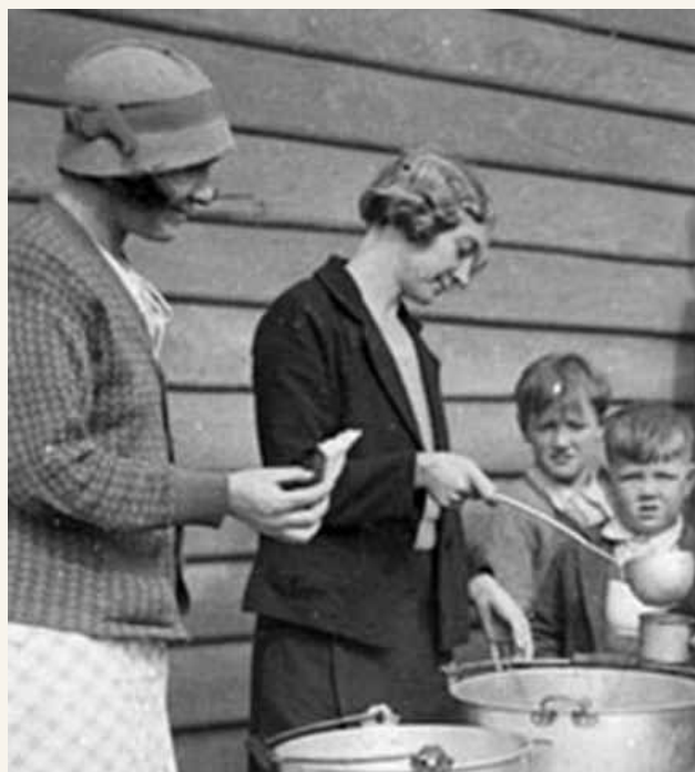
Jikoni la supu wakati wa Unyogovu Mkubwa

Uchumi ulianza kuwa bora mnamo 1932, lakini katika hali nyingi, uharibifu kwa familia haungeweza kutengenezwa. Wakati wa Unyogovu Mkubwa, jukumu muhimu la ufadhili wa Australia na wafanyakazi wakujitolea ulihimizwa.