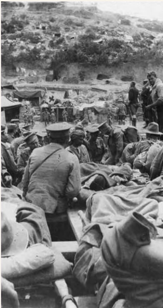
Gallipoli Peninsula wakati wa Vita vya Dunia I

Waliwekwa kando na katika sehemu mbaya na walilazimika kupanda milima walipokuwa wanapigwa risasi na majeshi ya Uturuki. Kwa njia fulani, walifika juu ya milima na wakachimba, walakini wanaume wengi walikufa. Waaustralia nyumbani walijivunia katika moyo wa Anzac.