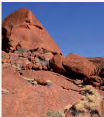
Mbuga la Kitaifa la Uluru-Kata Tjuta katika Wilaya ya Kaskazini

Tunakuhimiza kupanua uzoefu wako wa Australia kwa kutembelea maeneo haya ya ajabu na zaidi. Unaweza kutembea nyikani au ufuoni, milimani au kwenye misitu ya mvua. Kila hatua unayochukua iko karibu zaidi kujiungana na nchi hii kubwa na yenye nguvu.