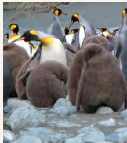
Kisiwa cha Macquarie kusini mwa Tasmania