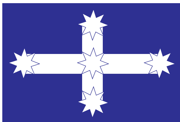
Bendera ya Eureka

Kundi ndogo lilijenga boma huko machimbo za Eureka na walipeperusha bendera yao ya kupinga na Msalaba wa Kusini juu yake. Maafisa wa serikali walituma askari kuvamia hifadhi asubuhi ya 3 Desemba 1854. Wachimbaji wa dhahabu walishindwa na karibu watu 30 waliuawa.