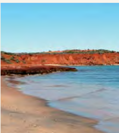
Shark Bay huko Western Australia