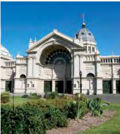
Jumba la Maonyesho ya Kifalme na Bustani za Carlton Melbourne