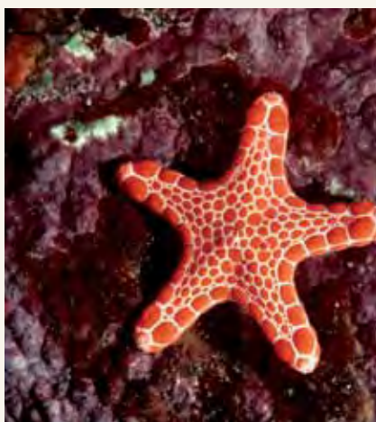
Great Barrier Reef huko Queensland