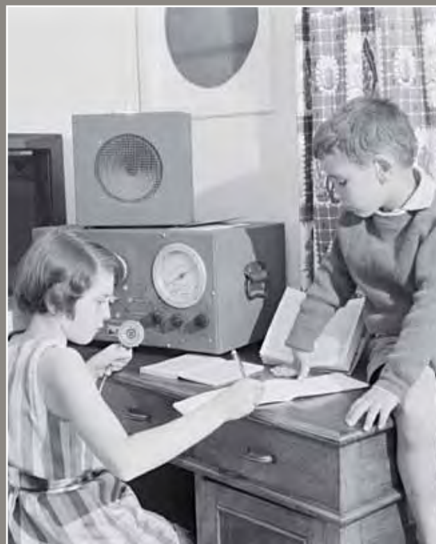
Watoto wanaosoma kupitia Shule ya angani (School of the Air) huko New South Wales

Redio mzee ya pedali sasa imebadilishwa na vipokea masafa ya juu, lakini Huduma ya Kifalme ya Daktari wa Ndege ya Australia na Shule ya Angani (School of the Air) inaendelea kuhudumia na kufaidi watu katika jamii za mashambani huko Australia.