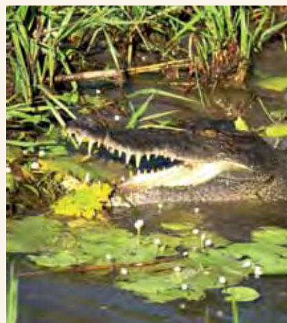
Mbuga la Kitaifa la Kakadu katika Wilaya ya Kaskazini