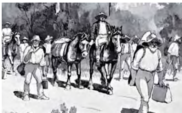
Dhahabu iligunduliwa kwanza katika koloni za New South Wales na Victoria mnamo 1851

Mwisho wa 1852, watu 90 000 walikuwa wamesafiri kwenda Victoria kutoka sehemu zote za Australia na kote ulimwenguni kutafuta dhahabu.