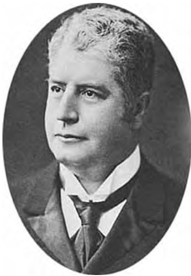
Sir Edmund Barton

Australia sasa ilikuwa taifa lakini bado ndani ya Ufalme wa Briteni. Haikupata nguvu kamili dhidi ya ulinzi na maswala ya kigeni hadi 1931. Ingawa hisia ya kitaifa ilikuwa imekua, wazo la kuwa Mbriteni bado ilikuwa na nguvu.