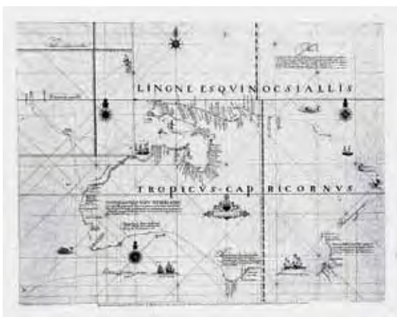
Ramani ya Abel Tasman wa New Holland, 1644

Australia pwani mashariki haikugunduliwa na Waulaya hadi Mwingereza James Cook alipoifikia mnamo 1770 katika meli yake, 'Endeavour'. Cook ametumwa na Serikali ya Briteni kwenye safari ya kugundua huko Pasifiki Kusini. Alikodisha pwani mashariki na kutua huko Botany Bay, kusini kutoka Sydney ya kisasa. James Cook aliita nchi hii 'New South Wales', na aliidai kwa King George III.