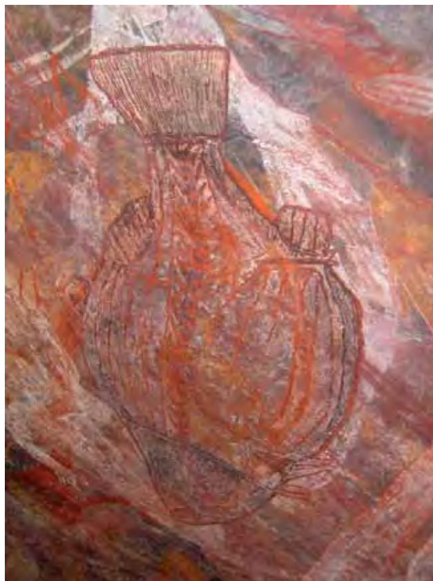
Sanaa za watu wa asili wa Kakadu

Ukoo tofauti za asili zina jina lao la ile ambayo sisi tuaita kwa Kiingereza 'Kuota'. Kuota au, Wakati wa kuota, ni mfumo wa maarifa, imani na desturi ambazo zinaongoza maisha ya asili. Inaonyesha watu jinsi wanapaswa kuishi na jinsi wanapaswa kutenda. Watu wasiofuata sheria zake huadhibiwa.