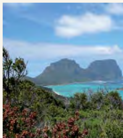
Kisiwa cha Lord Howe mbali na pwani ya New South Wales