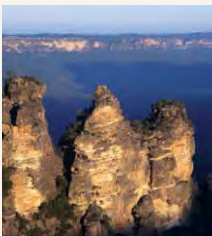
Milima ya Greater Blue magharibi mwa Sydney