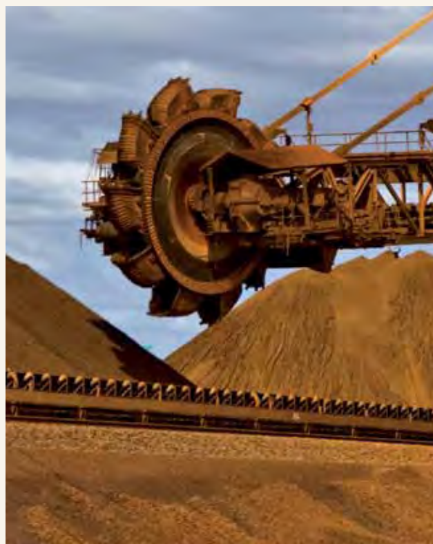
Sekta kubwa ya mahuruji ya Australia ni madini na mafuta

Australia ina rasilimali asili nyingi kama kaa, shaba, gesi asili yenye maji na michanga ya madini. Hizi zinahitajika sana, haswa katika kukuza uchumi huko Asia.