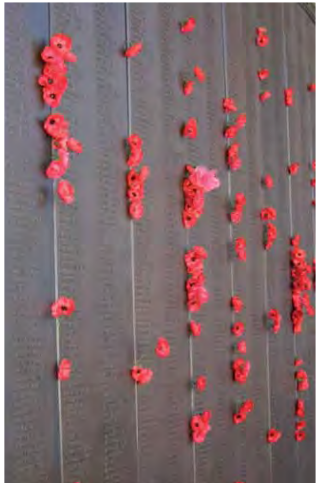
Mpopi nyekundu umetumiwa kama ishara ya ukumbusho tangu Vita vya Dunia I

Sherehe za Siku ya Anzac vile vile, Siku ya Ukumbusho pia ni siku ambayo Waustralia hukumbuka wale ambao walihudumu na kufa kwenye vita. Saa 5 asubuhi (11am) mnamo 11 Novemba (mwezi wa 11) kila mwaka, Waustralia walisitisha kujitolea kwa wanaume na wanawake ambao walikufa au kuumia katika vita na mizozo, na pia wote waliohudumu vile vile. Sisi huvaa mpopi nyekundu siku hii.