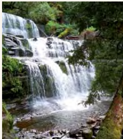
Nyika ya Tasmanian