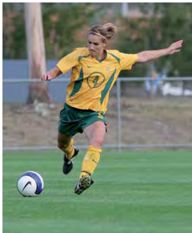
Mwanachama wa timu ya Kandanda ya Kitaifa ya Wanawake ya Australia