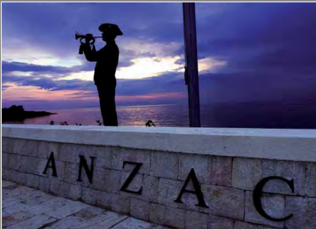
Ibada ya mapambazuko ya Huduma ya Anzac (Anzac Day Dawn Service) huko Gallipoli

Siku ya Anzac sasa ni siku ya kuheshimu wote ambao walihudumu katika vita, mizozo na oparesheni za amani. Sio sherehe ya kijeshi. Haiheshimu ushindi – kampeni ya Gallipoli haikufaulu. Inaheshimu ubora wa wanajeshi: kujali, kuvumilia na ucheshi katika hali ya dhiki. Leo, Siku ya Anzac ilikumbukwa huko Australia na kote ulimwenguni. Wanajeshi wa Australia waliorudi kutoka kwa Vita vya Dunia II na mizozo mingine, na waweka amani na askari wastaafu kutoka kwa nchi zenye Uhusiano, wote huandamana katika gwaride za Siku ya Anzac.