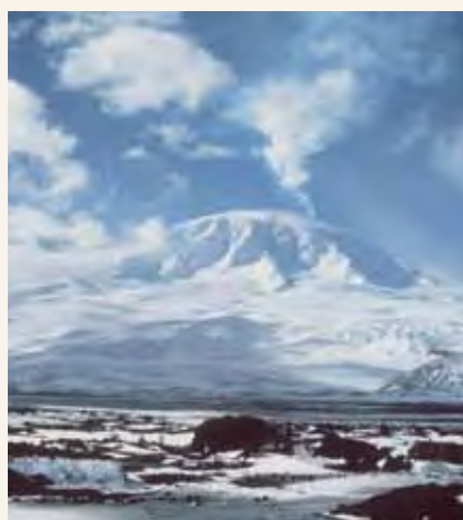
Kisiwa cha Heard na Visiwa vya McDonald katika Wilaya ya Antarctic ya Australia