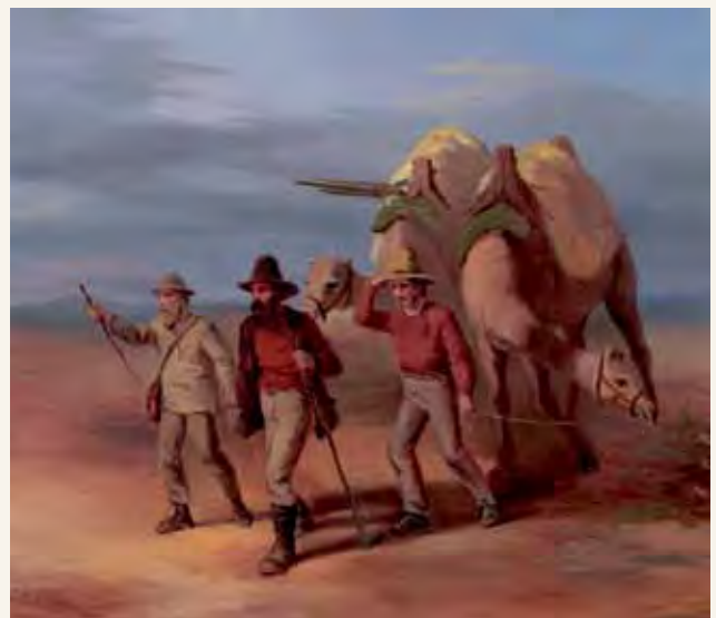
Ugunduzi wa Burke na Wills kuvuka Australia, 1860

Mnamo 1860 Burke na Wills waliondoka kwa Melbourne kupitia Australia kutoka kusini kwenda kaskazini. Waliongoza uchunguzi mkubwa lakini njia za kuvuka likuwa ngumu sana. Burke na Wills hawakuwa wana wenye uzoefu wa pori. Walipokea msaada kutoka kwa watu wa asili wa Yandruwandha lakini wagunduzi wote wawili waliaga duniani walipokuwa wanarudi. Hata ingawa Burke na Wills walikosa kukamilisha ugunduzi wao, hadithi yao hukumbukwa katika sanaa na fasihi. Ni mfano tanzia wa ugumu wa nchi yetu.