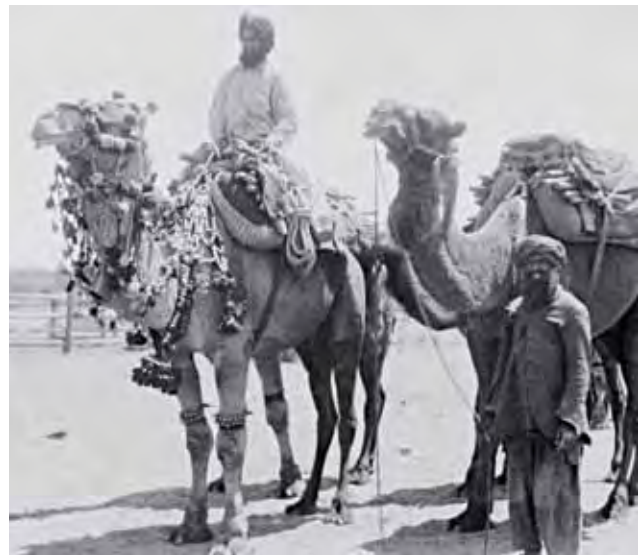
Watunza ngamia wa 'Afghan' katika porini ya Australia

Kuanzia 1880, wafanyikazi kutoka Lebanon waliwasili Australia. Walebanisi wengi walihusika katika tasnia za vitambaa na nguo. Familia za Lebanisi zilikuja kumiliki biashara nyingi za kuuza nguo katika nchi ya Australia, utamaduni ambao unaendelea hivi leo.