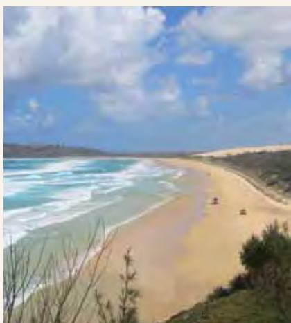
Kisiwa cha Fraser mbali na pwani la Queensland kusini