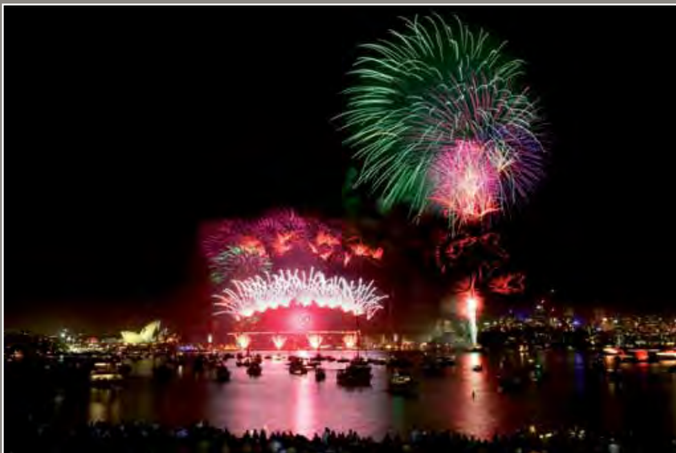
Usiku wa kuamkia Mwaka Mpya fataki juu ya Sydney Harbour 2005

Siku kuu zingine za umma hufanywa katika majimbo, wilaya na miji. Kwa mfano, Wilaya Kuu ya Australia ina Siku ya Canberra, Australia Kusini ina Siku ya watu wa Kujitolea na Australia Magharibi ina Siku ya Wakfu.