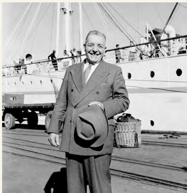
Mhamiaji wa Ulaya kuwasili huko Australia

Walikaa tu kwa muda mfupi kwenye kambi lakini walijifunza kitu kuhusu nchi na watu wake. Baada ya vita, wengi walirudi Australia kama wahamiaji.