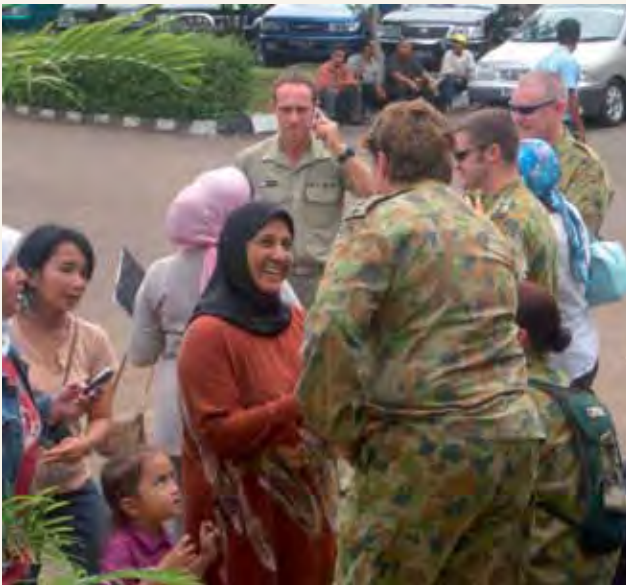
Oparesheni ya msaada ya Australia huko Indonesia baada ya sunami ya Bara Hindi mnamo 2004

Waaustralia huonyesha upendo mkubwa wakati janga linatokea katika nchi yetu na ng'ambo. Sisi pia huchanga mara kwa mara kwa nchi zinazopitia shida inayoendelea. Australia kujitolea kwa mpango wetu wa msaada inaonyesha desturi hii ya ukarimu ya Australia.