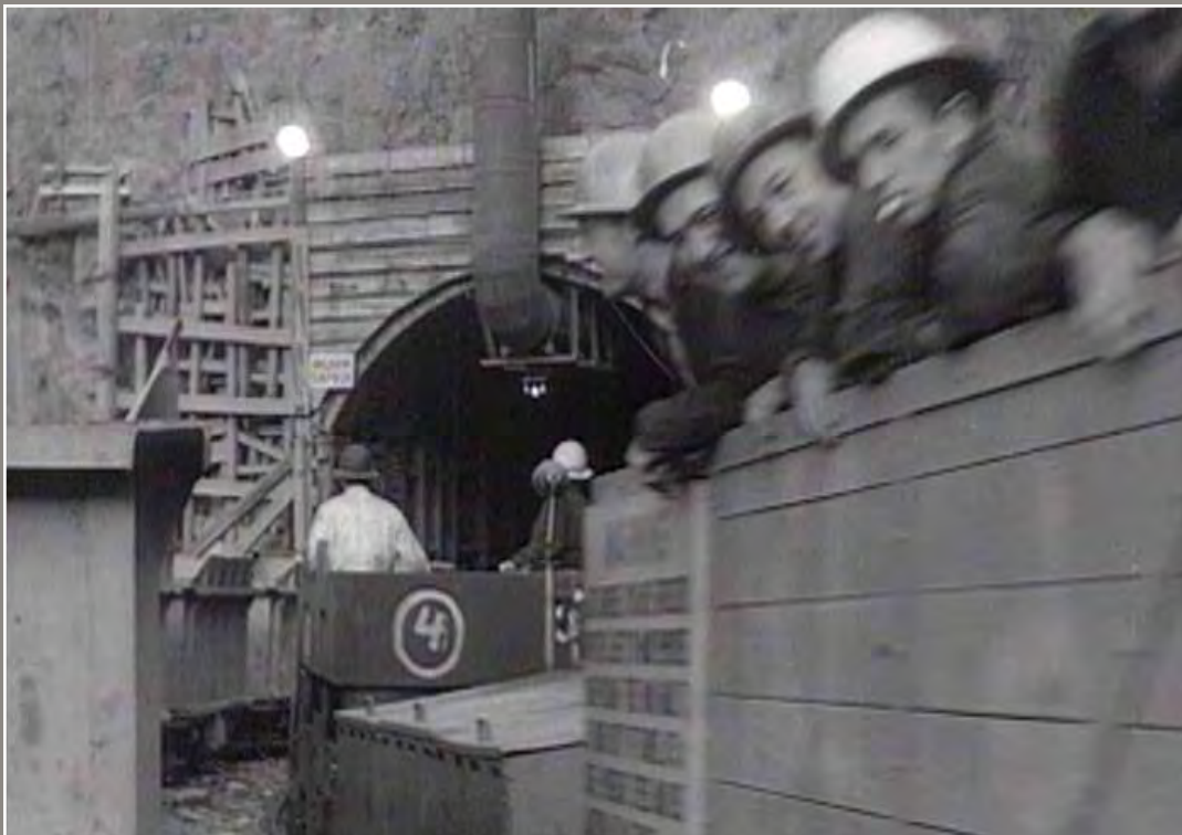
Wafanyikazi kwenye Mpango wa Milima wa Snowy

Kwa uzuri wa mazingira, serikali ya Victoria na New South Wales zimekubali kurejesha mwondo wa mto kwa asilimia 28.