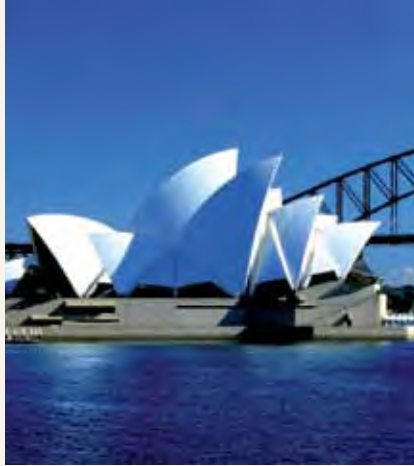
Jumba la Sydney Opera