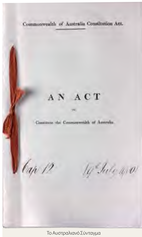
Το Αυστραλιανό Σύνταγμα

Σε ένα δημοψήφισμα πρέπει να υπάρχει «διπλή πλειοψηφία» προκειμένου να τροποποιηθεί το Αυστραλιανό Σύνταγμα. Δηλαδή, τόσο η πλειοψηφία των ψηφοφόρων στην πλειονότητα των πολιτειών όσο και η πλειοψηφία των ψηφοφόρων σε όλο το έθνος πρέπει να ψηφίσουν υπέρ της τροποποίησης.