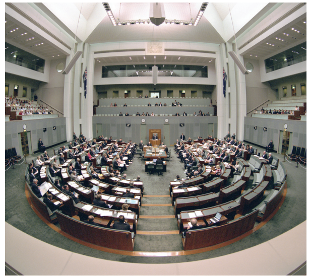
Η Βουλή των Αντιπροσώπων

Τα μέλη του Κοινοβουλίου και οι γερουσιαστές συζητούν για προτάσεις όσον αφορά νέους νόμους στο κοινοβούλιο της Αυστραλίας. Ο ρόλος της Βουλής των Αντιπροσώπων είναι να εξετάζει, να συζητά και να ψηφίζει για προτάσεις που αφορούν νέους νόμους ή αλλαγές στους υπάρχοντες νόμους και να συζητά για θέματα εθνικής σημασίας.