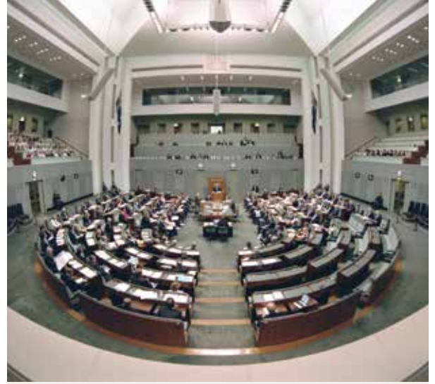
प्रतिनिधि सभा/लोक सभा

संसद के सदस्य और सीनेटर ऑस्ट्रेलियाई संसद में नए कानूनों के लिए प्रस्तावों पर चर्चा करते हैं। प्रतिनिधि सभा या लोक सभा का महत्वपूर्ण कार्य नए कानूनों या कानूनों में परिवर्तन सम्बंधी प्रस्तावों पर विचार, चर्चा एवं मतदान करना है, और राष्ट्रीय महत्व के विषयों पर चर्चा करना है।