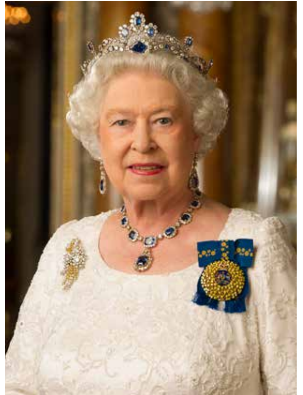
महामहिम महारानी एलिजाबेथ द्वितीय

संसदीय लोकतंत्र की ऑस्ट्रेलियाई प्रणाली ब्रिटिश और उत्तरी अमेरिका की परंपराओं को एक ऐसे तरीके से संयोजित करके दर्शाते हैं जो विशिष्ट रूप से ऑस्ट्रेलियाई है। ऑस्ट्रेलियाई प्रणाली में, ऑस्ट्रेलियाई सरकार का नेता प्रधानमंत्री होता है।